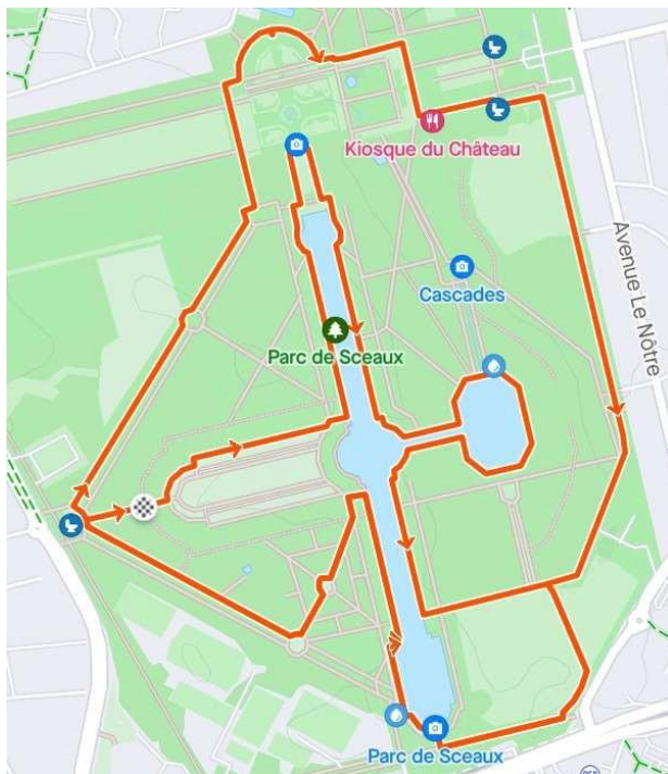
Parcours 10 km